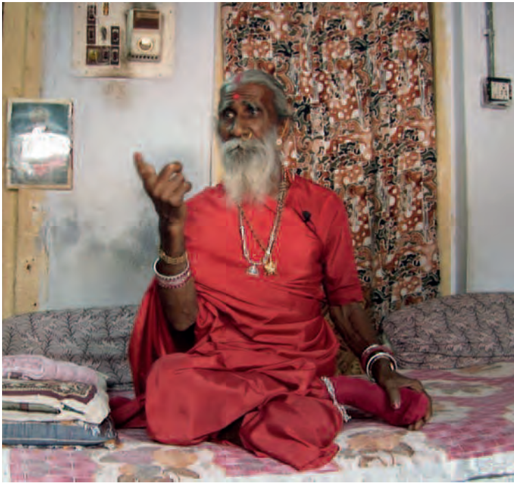
Indien »Mataji« Prahlad Jani - Yogi aus Gujarat, Indien