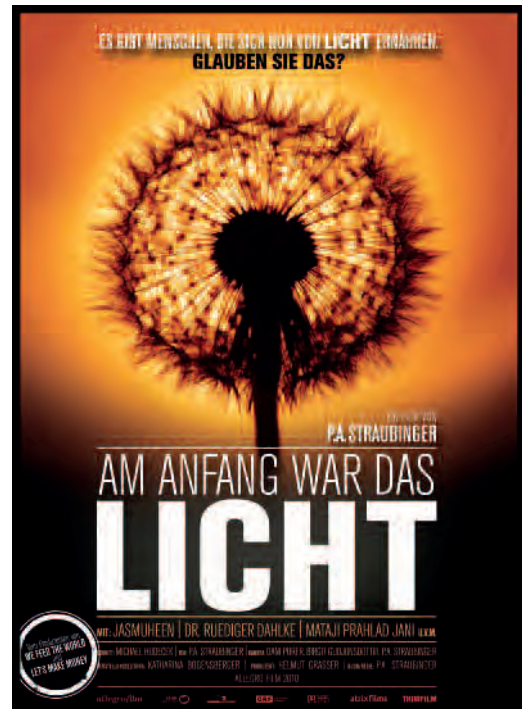
Plakat zum Film