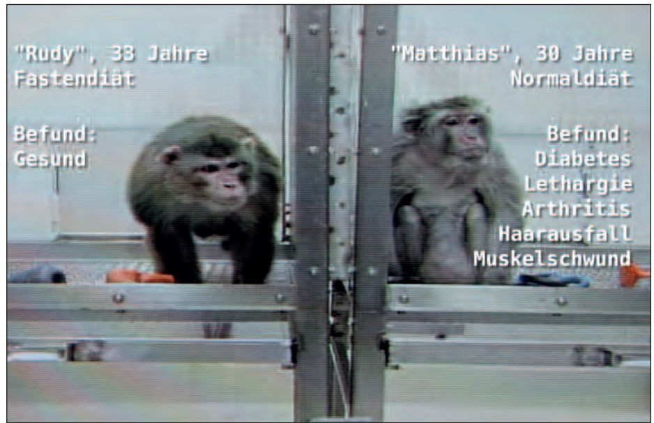
Auswirkung von Fasten auf den Körper am Versuch bei Affen